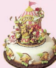
坂西 彩 制作

NPO法人ドリームケーキプロジェクト副理事長として、夢ケーキを通しての家族団らんや復興支援の活動をこれからも行ってまいります。