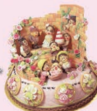
萩原 恵 制作

伊賀白鳳高校パティシエコース 3年生の卒業制作「夢ケーキ」の 技術指導もさせていただきました。